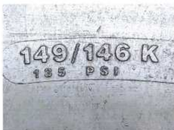
Hình 3: Chỉ số khả năng chịu tải và cấp tốc độ