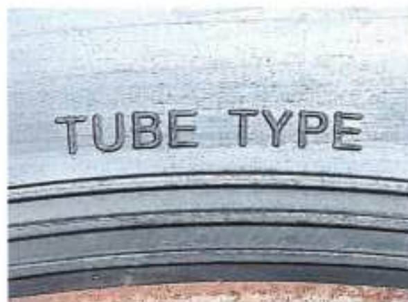
Hình 5: Lốp là loại có/không sử dụng sơm