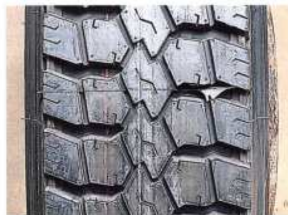
Hình 4: Mẫu vân lốp