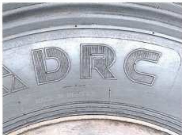
Hình 1: Nhân hiệu