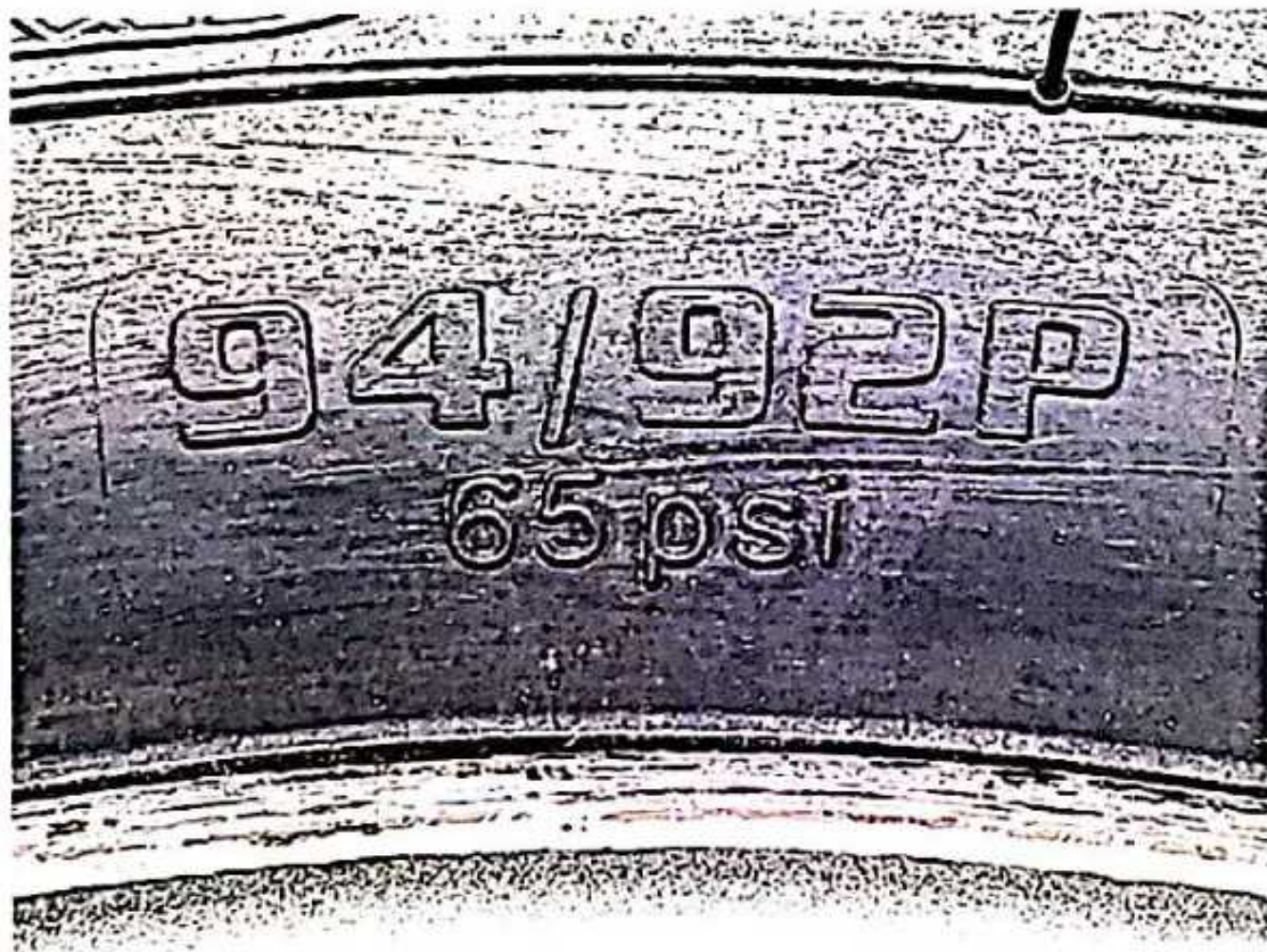
Hình 3: Chỉ số khả năng chịu tải và cấp tốc độ