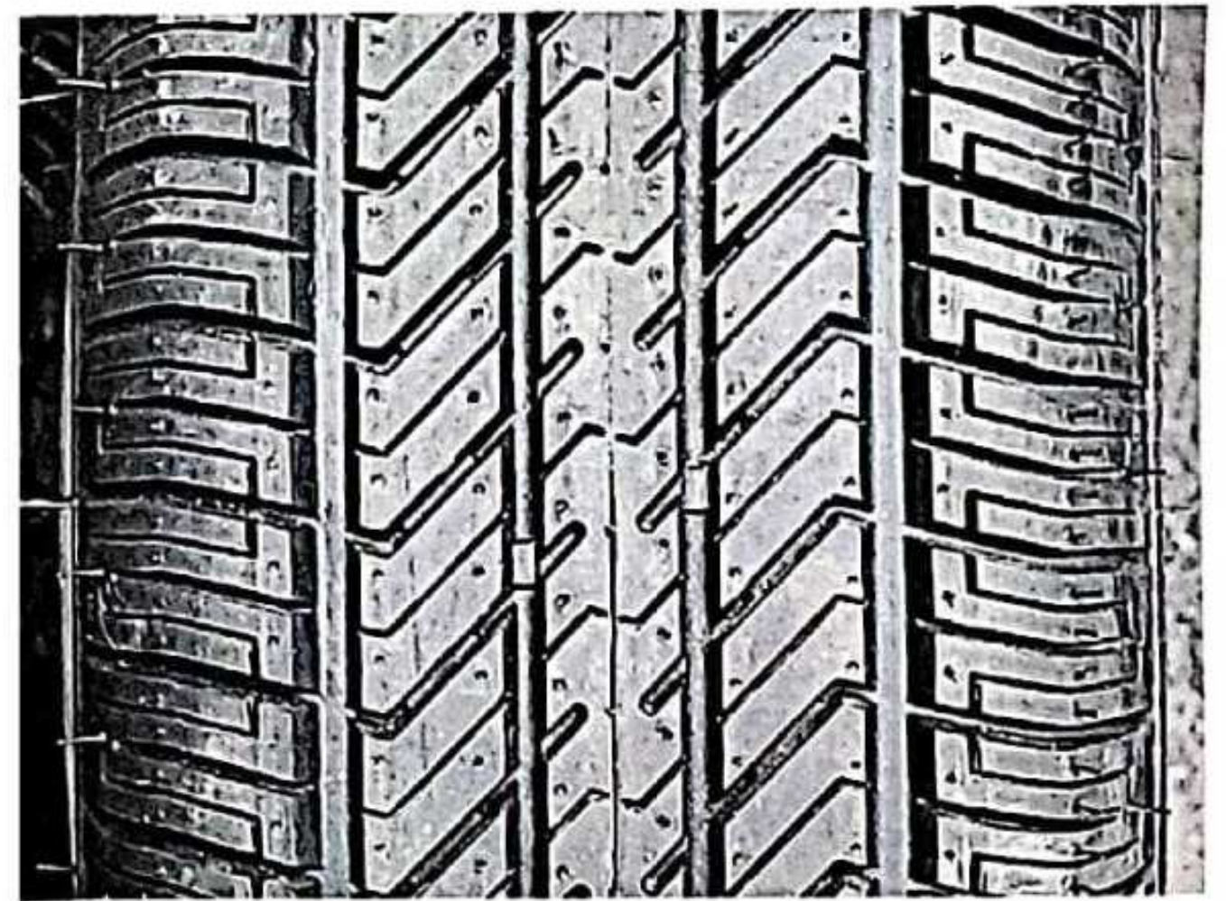
Hình 4: Mẫu vân lốp