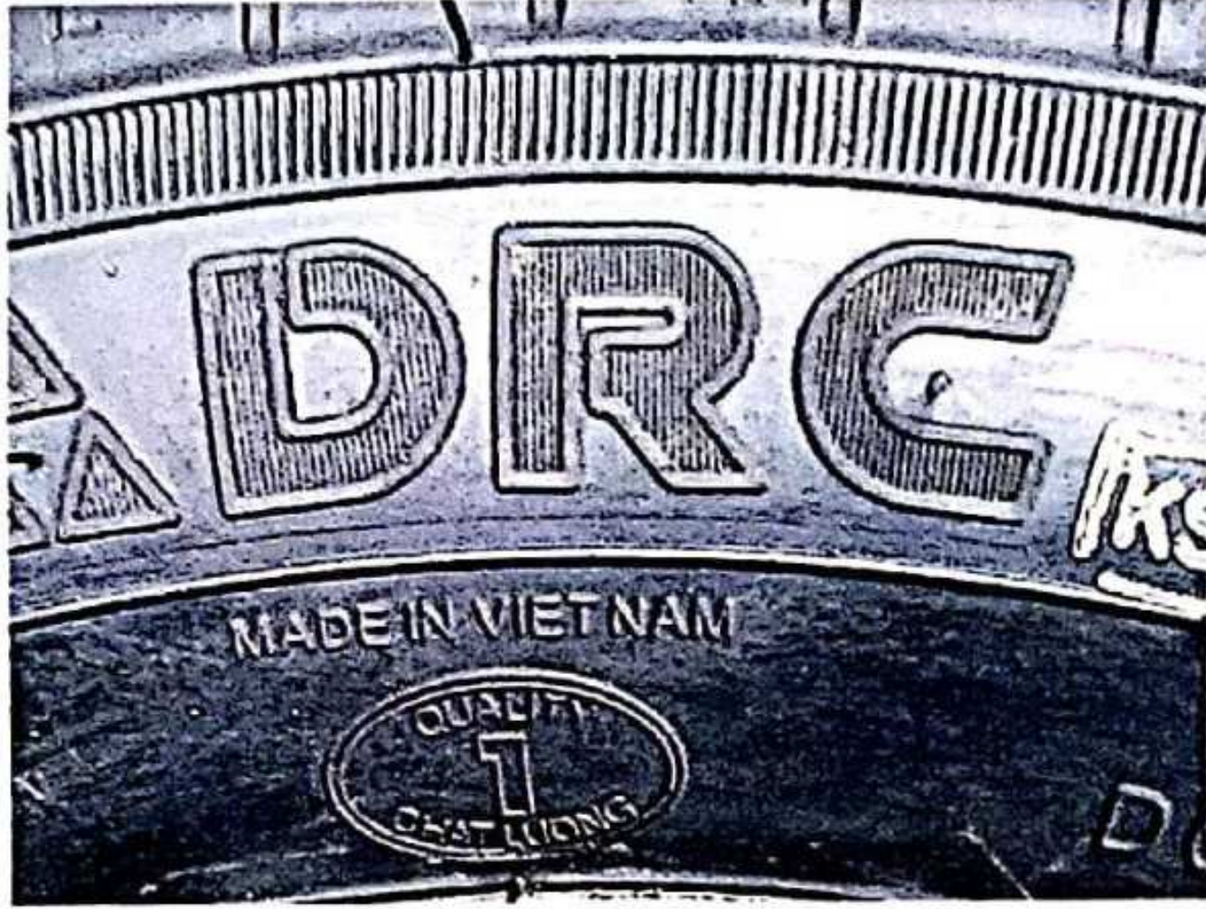
Hình 1: Nhân hiệu