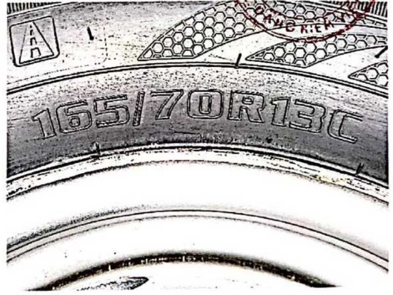
Hình 2: Ký hiệu kích cỡ lốp GIỚI