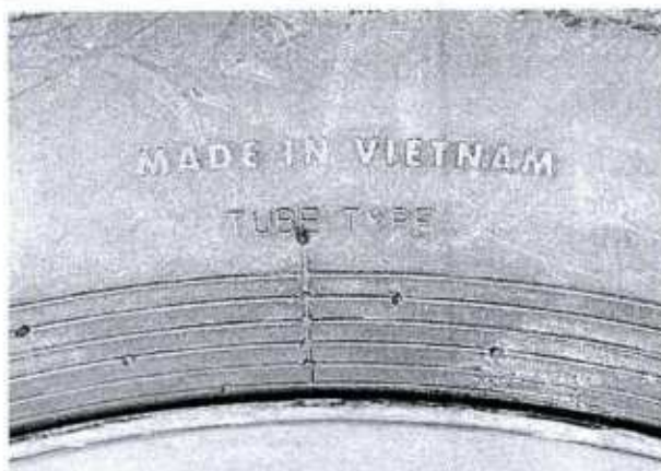
Hình 5: Lốp là loại có/không sử dụng sơm