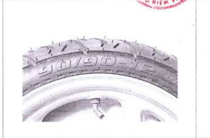
Hình 3: Chỉ số khả năng chịu tải và cấp tốc độ