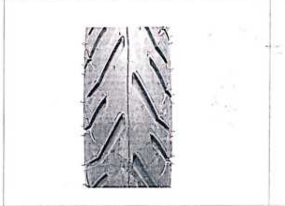
Hình 4: Mẫu vân lốp