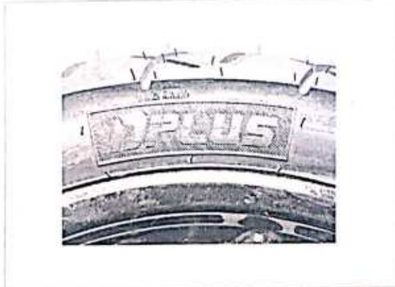
Hình 1: Nhân hiệu