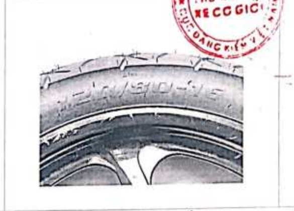
Hình 2: Ký hiệu kích cỡ lốp