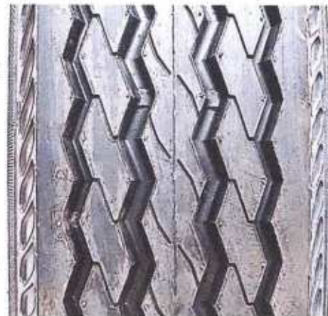
Hình 4: Mẫu vân lốp