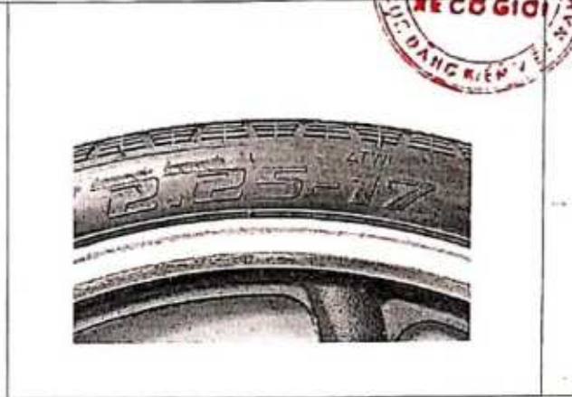
Hình 2: Ký hiệu kích cỡ lốp