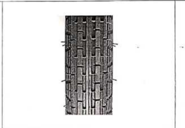
Hình 4: Mẫu vân lốp