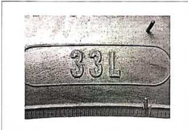
Hình 3: Chỉ số khả năng chịu tải và cấp tốc độ