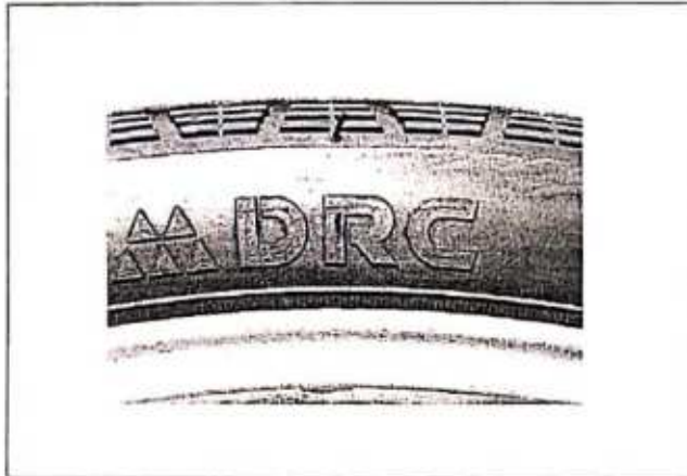
Hình 1: Nhân hiệu