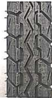
Hình 4: Mẫu vân lốp