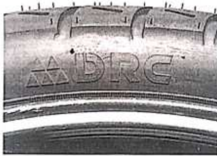
Hình 1: Nhân hiệu